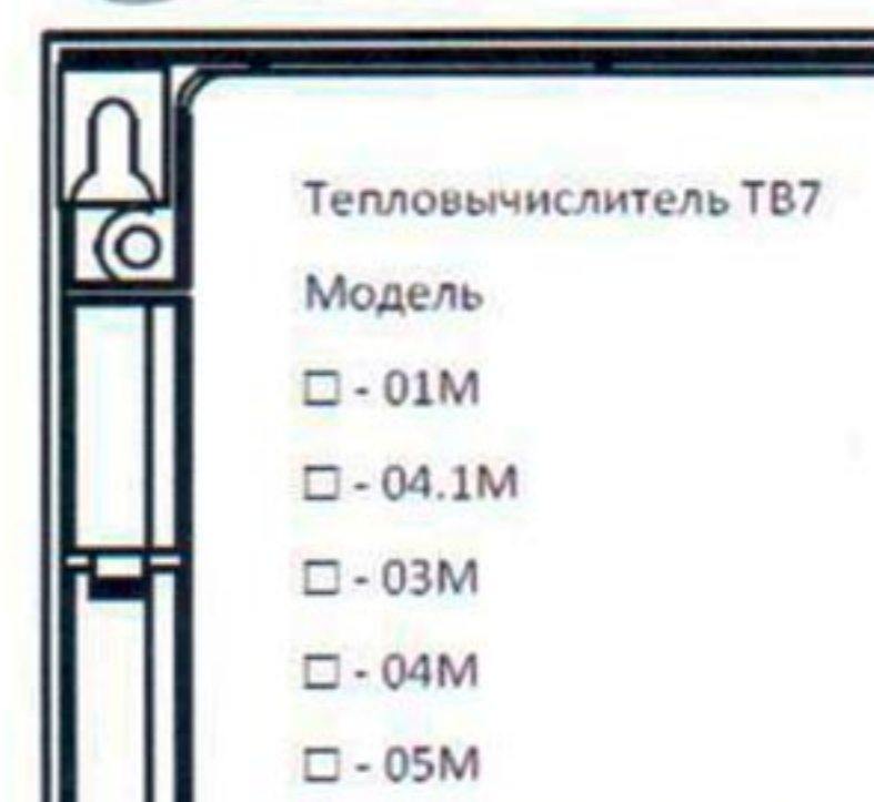
б) исполнение М